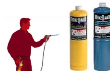
Plyn MAP//pro a PROPANE