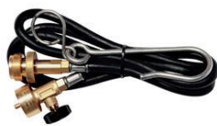
Propojovací hadice 4770