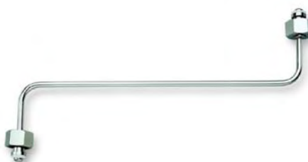
kat. č. 3.5199

Při plnění se musí zachovat 10% rezerva z důvodů roztažnosti plynu. Láhve podléhají pravidelným kontrolám dle platných bezpečnostních předpisů o tlakových nádobách.