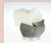
K-20 IA Rohový svar, 20 mm Obj. č.: 145.940