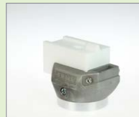
V-8/10 IA V-svar, 8/10 mm Obj. č.: 145.915