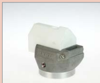
K-5/6 IA Rohový svar, 5/6 mm Obj. č.: 145.943

Integrovaný přívod vzduchu: Přívod vzduchu je integrovaný do svařovací botky, což umožňuje otáčení botky o 360° do jakékoliv svařovací polohy.