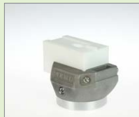
V-5/6 IA V-svar, 5/6 mm Obj. č.: 145.912