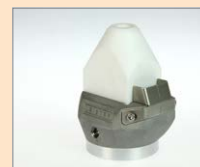
CL-14 IA Koutový svar, 14 mm Obj. č.: 145.811