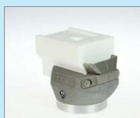
UBL-35 IA Přepletovací svar, 35 mm Obj. č.: 145.897