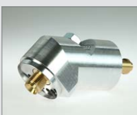
45° Adaptér úhlový WP S2 Obj. č.: 139.460