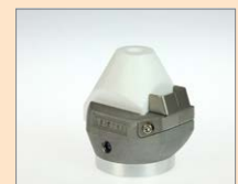
CS-20 IA Koutový svar, 20 mm Obj. č.: 145.488