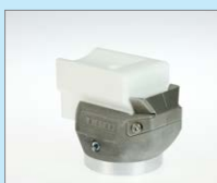
UBL-30 IA Přepletovací svar, 30 mm Obj. č.: 145.947