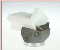
K-30 IA Rohový svar, 30 mm Obj. č.: 145.817