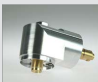
90° Adaptér úhlový WP S2 Obj. č.: 139.461