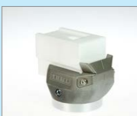
UBL-25 IA Přepletovací svar, 25 mm Obj. č.: 145.896