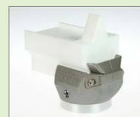
V-25 IA V-svar, 25 mm Obj. č.: 145.916