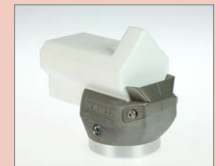
K-25 IA Rohový svar, 25 mm Obj. č.: 145.816