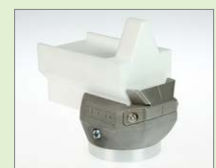
V-30 IA V-svar, 30 mm Obj. č.: 145.905