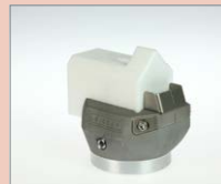
K-15 IA Rohový svar, 15 mm Obj. č.: 145.812