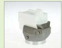
V-15 IA V-svar, 15 mm Obj. č.: 145.903