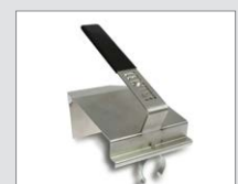
Reflektor předehřívací Obj. č.: 136.231