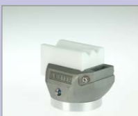
CO-8 IA Koutový svar vnější, 8 mm Obj. č.: 146.643