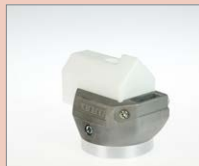
K-8/10 IA Rohový svar, 8/10 mm Obj. č.: 145.944