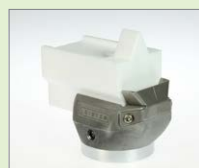
V-20 IA V-svar, 20 mm Obj. č.: 145.909