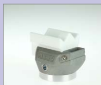
CO-12 IA Koutový svar vnější, 12 mm Obj. č.: 146.649