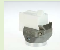
V-12 IA V-svar, 12 mm Obj. č.: 145.907