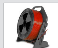
Odvíječ drátu Obj. č.: 144.095