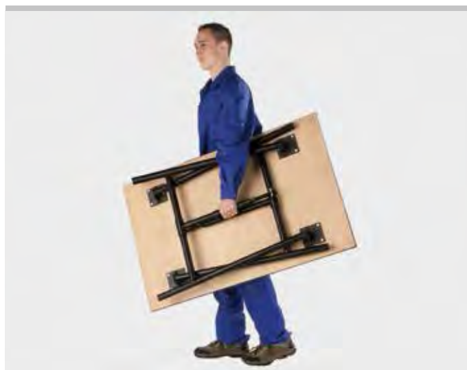
Kvalitní německý výrobek

Vysoce zatížitelný, max. nosné zatížení 300 kg.